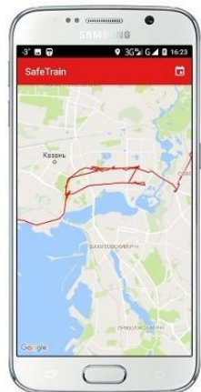
Просматривай маршрут онлайн

Звуковое и вибро-оповещение при нахождении в опасной зоне