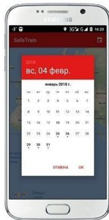
Отслеживай историю передвижений по датам